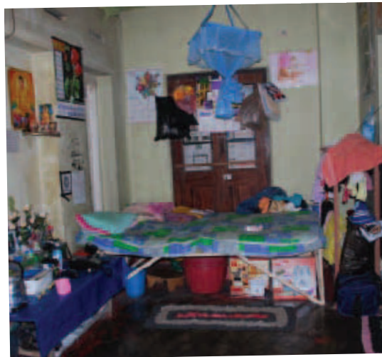
El cuarto de Sandamalee en la casa donde está alojada

No me puedo permitir visitar a mi familia tanto como quisiera. Ellos viven en un pueblo en el campo, a más de 300km de la casa donde me alojo. Mi padre es campesino, tengo tres hermnas y tres hermanos. Les envío cada mes 33,50€ a casa, para ayudarlos.